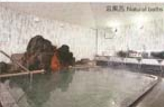
元湯系 Natural baths