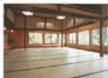
小宴会場「和庭」 Banquet hall "Yoshitsuna"

Bath composition: Sodium chloride water, alkaline composition, high temperature at 42.6 degrees C. The baths are therapeutic for the following conditions: Chronic women's diseases, chronic skin complaints, cuts, burns, infant neuralgia, muscle pain, joint pain, bruises, chronic gastrointestinal complaints, convalescence, fatigue recovery, health.