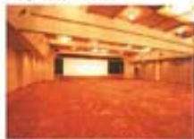
コンベンションホール「春の風」 Convention hall "Sakus no kaze"