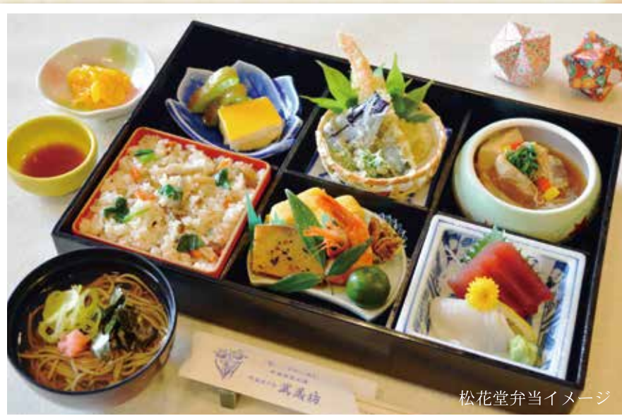
松花堂弁当イメージ

毎週木曜日は浴場メンテナンスの為、 日帰り入浴はご利用いただけません。 また、諸般の事情により急遽定休日が変更に なる場合がございます。予めご了承ください。